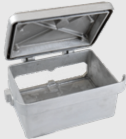
Antriebsgehäuse 3,5kg - 30x25x15cm