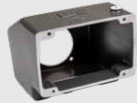
Abdeckung 1,6kg - 17x18x15cm

Hier finden Sie einige Beispiele aus der breiten Palette, der von uns gefertigten Gusserzeugnisse. Für Produktbeispiele aus der WT nehmen Sie bitte Kontakt mit uns auf.