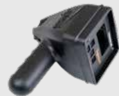
Griffgehäuse 1,3kg - 22x18x13cm