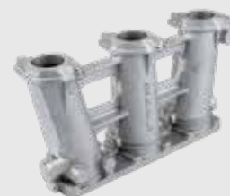
Saugrohr 2kg - 31x17x9cm