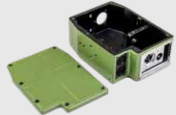
Elektronikgehäuse 1,6kg - 18x15x10cm