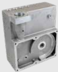
Gehäuse 6,4kg - 35x30x15cm