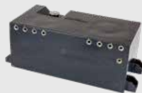
Kühlmittelbehälter 18kg - 70x30x30cm