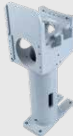
Dosierschnecken-gehäuse 2,5kg - 36x10x15cm