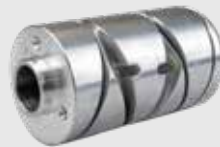
Führungstrommel 1,1kg - 19x10cm