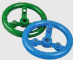
Handräder 0,5kg - 20cm